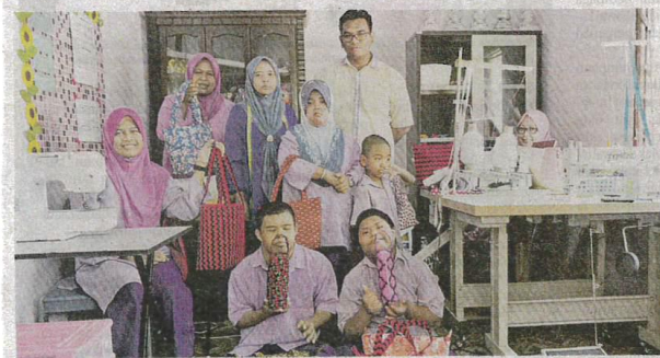
Pelatih memegang produk beg keluaran PDK Mutiara Kasih, Kampung Bukit Diman.

Difahamkan, PDK Kuala Berang keluaran produk sejuk beku.