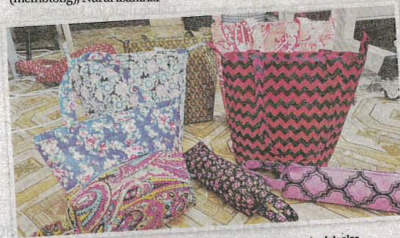
Antara beg dihasilkan empat pelatih PDK Mutiara Kasih dengan tunjuk ajar penyelia serta pembantu PDK.